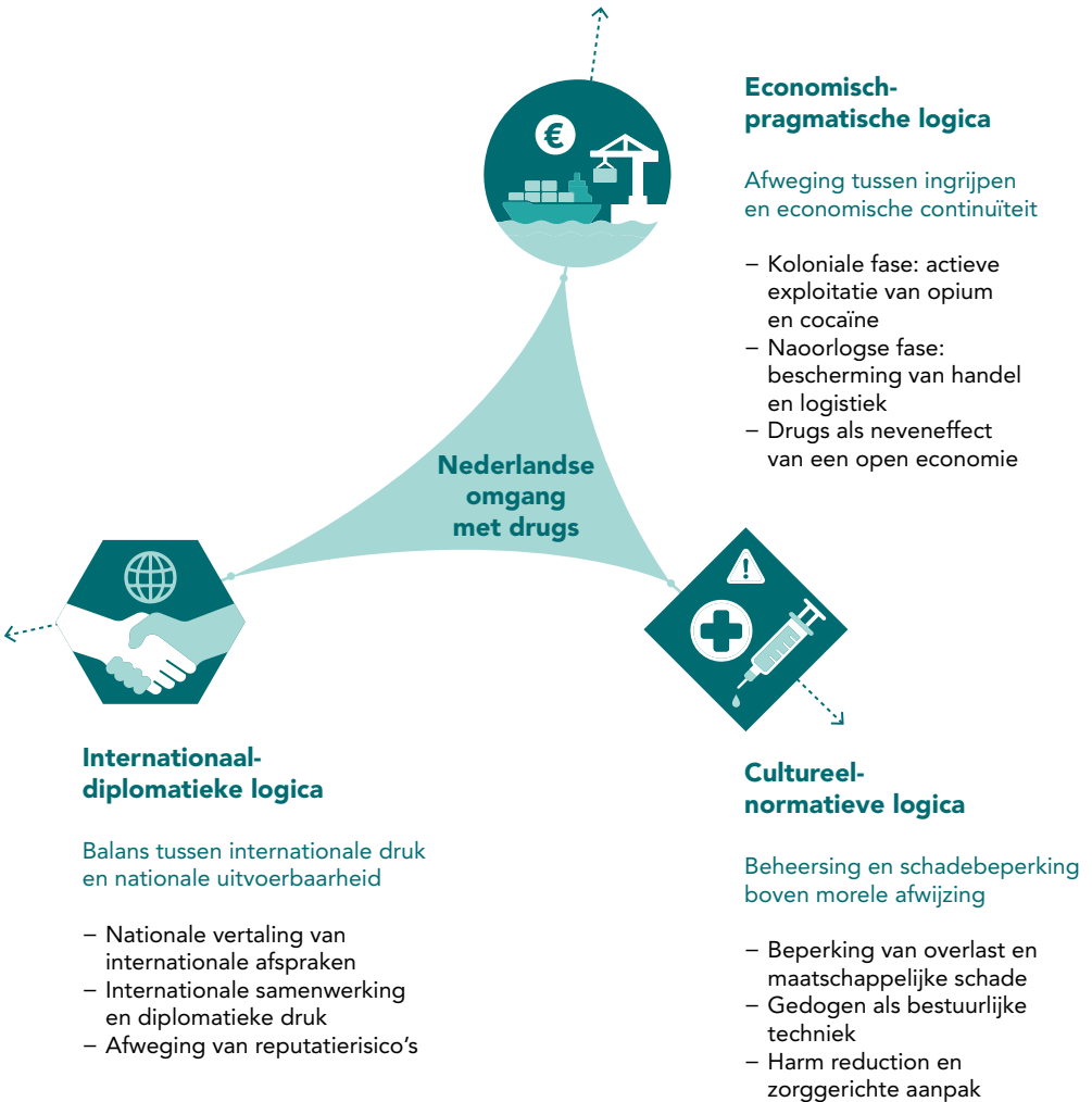
Figuur 1 Drie structurele logica's in de Nederlandse omgang met drugs