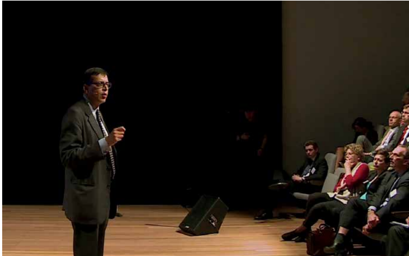
Pankaj Ghemawat tijdens het publieksseminar 'Europe 3.0'