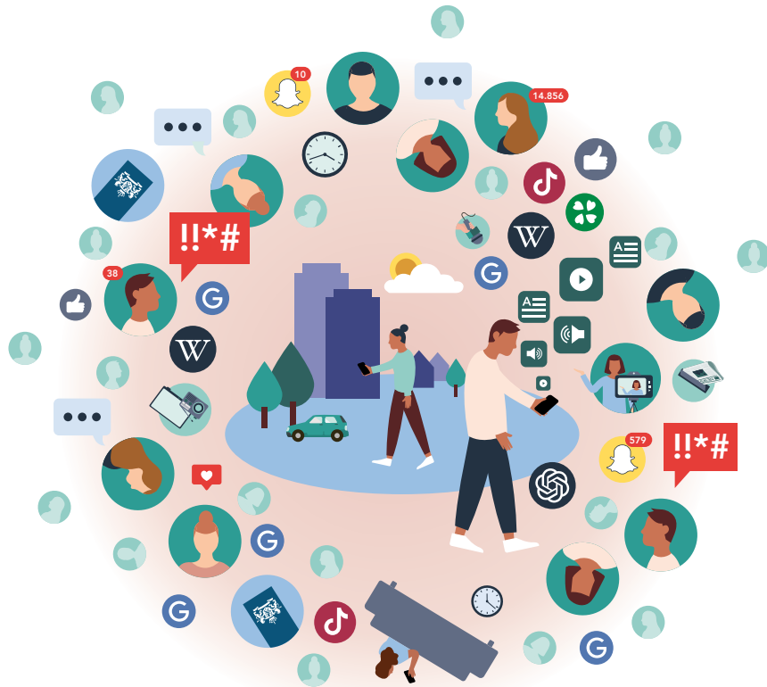
Figuur 3 Digitale informatieomgeving