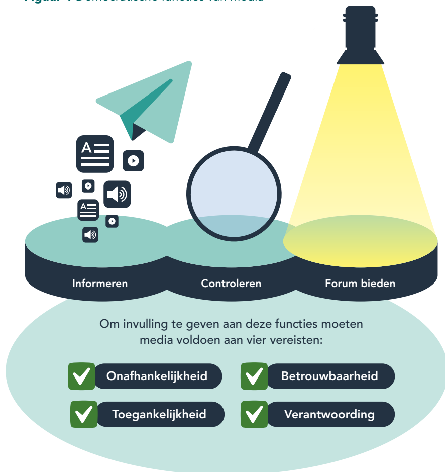
Figuur 1 Democratische functies van media

De rol die media in een democratische samenleving spelen kan aan de hand van drie onderling verbonden functies worden beschreven. Allereerst informeren media de samenleving. Zelfs in de meest minimale democratieopvatting zijn media nodig om burgers en politici van noodzakelijke informatie te voorzien. Deze informatie ondersteunt vervolgens ook het controleren van de macht. Media fungeren hierbij als waakhond, ze monitoren de macht en brengen misstanden in de openbaarheid. Tenslotte bieden media een forum aan de verschillende ideeën, opinies en perspectieven die in de samenleving rondgaan. Hoe media precies invulling geven aan deze functies is geen uitgemaakte zaak. Zij kunnen de democratie ondersteunen maar evenzogoed ondermijnen of ontwrichten, bijvoorbeeld door eenzijdig gekleurde of onware informatie te verspreiden. Voorwaardelijk aan ondersteuning van de democratie is dat het mediasysteem onafhankelijk, betrouwbaar en toegankelijk is. En dat media ook zelf als machtsfactor in de samenleving ter verantwoording geroepen kunnen worden.