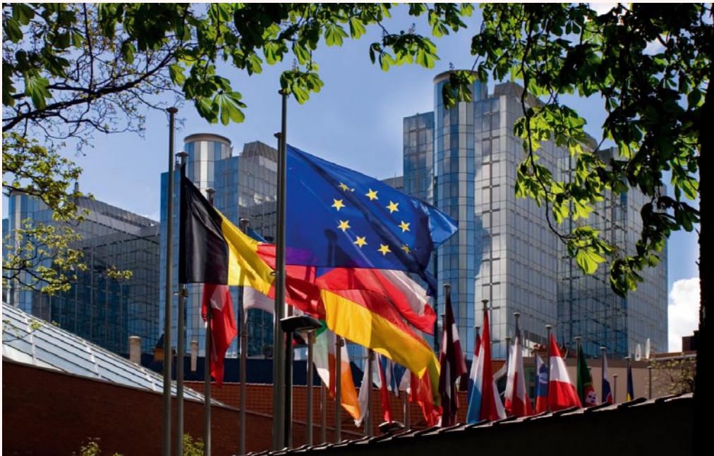
De vlaggen van de 27 lidstaten van de Europese Gemeenschap voor het gebouw waar de Europese commissie zetelt in Brussel

Het besef dat het proces van mondialisering gepaard gaat met verrassingen, toevaligheden en onvoorspelbaarheid, fortuna in de woorden van Niccolò Machiavelli, veronderstelt op het niveau van beleid virtù , een houding van flexibiliteit, reflexiviteit, vernieuwing en openheid, die noodzakelijk is om met ambitie en vertrouwen de toekomst tegemoet te treden. Dit perspectief, waarbij mondialisering wordt