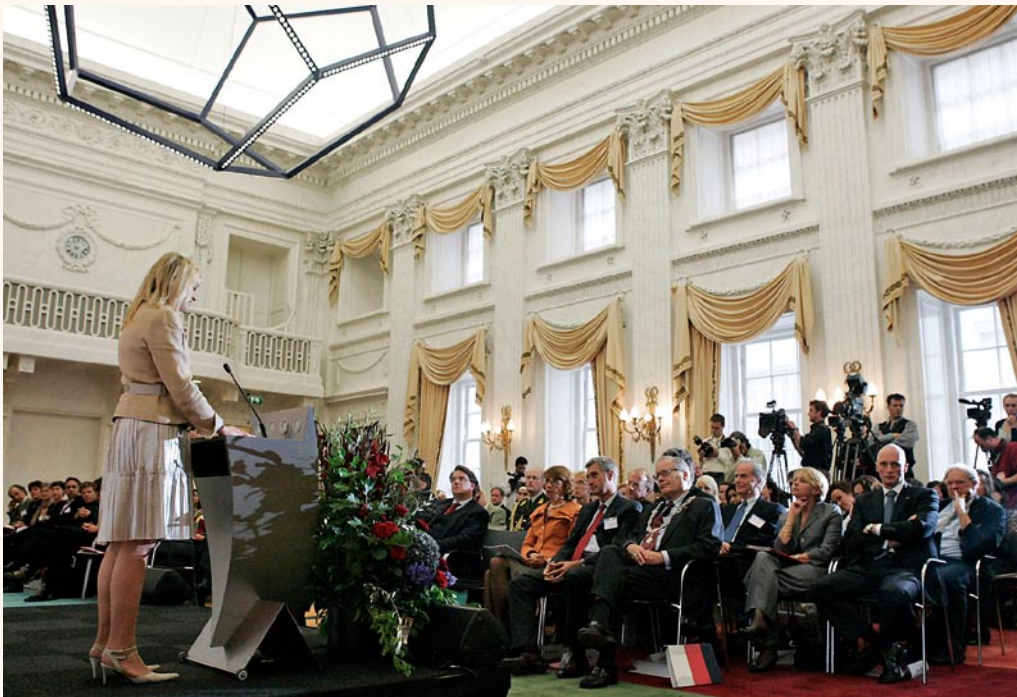
H.K.H. Prinses Máxima spreekt bij de presentatie van het rapport Identificatie met Nederland

Behalve de kwaliteit van rapporten is ook de publieke presentatie daarvan uiterst belangrijk, zeker nu wetenschappelijk gezag niet meer vanzelfsprekend is. Horzelsfunctie, stenen gooien in de Hofvijver en vele andere metaforen zijn al gebruikt om aan te geven wat velen als een kernfunctie zien van de WRR: aanzetten tot nadenken, ter stimulering van het leervermogen van overheid en samenleving. Terecht beklemtoonde de evaluatiecommissie in dat kader de eigen actieve deelname van de raad aan het publieke debat, ondanks “intense reacties vanuit de media of vanuit