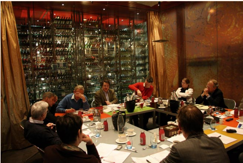
De raad aan het werk. Een discussieochtend tijdens een werkbezoek aan Maastricht

De raad maakt bij zijn werk gebruik van uiteenlopende vormen van kennis, belichaamd door verschillende typen deskundigen; niet alleen wetenschappers maar ook beleidsmakers, praktijkmensen en soms belanghebbenden. De raad is van plan aan de relatie met deze deskundigen meer aandacht te besteden, zowel voorafgaand