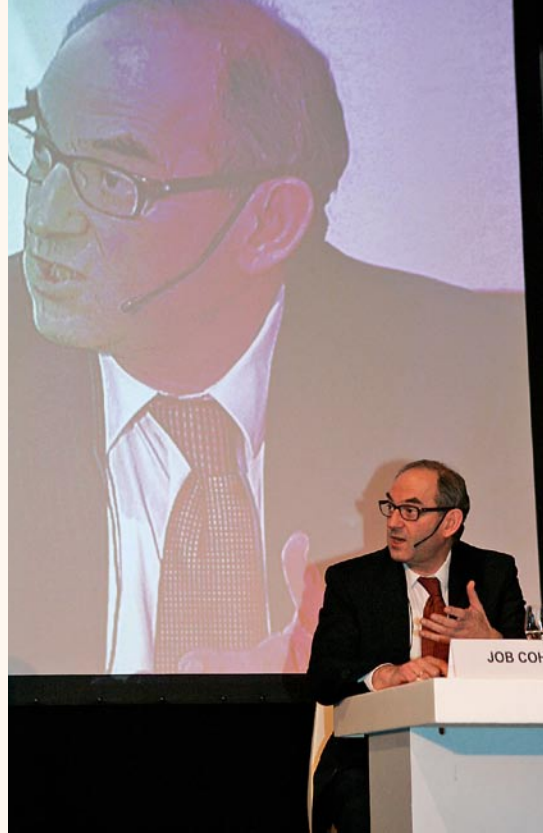
De burgemeester van Amsterdam, Job Cohen, discussieert in het panel van de WRR-lecture 2006 over Religie en publiek domein

Onderdeel van het communicatiebeleid is ook het streven naar een grotere toegankelijkheid van publicaties. Al bij het rapport Waarden, normen en de last van het gedrag (rapport nr. 68) is een korte versie gepubliceerd, bestemd voor een breder publiek, en rapporten als Focus op functies (rapport nr. 71) en Infrastructures (rapport nr. 81) gaan vergezeld van zelfstandig leesbare, uitgebreide samenvattingen. Het ligt in de bedoeling deze aanpak een structureel karakter te geven. Ook zullen op de WRR-website themagerichte ‘dossiers’ worden ingericht waarin diverse publicaties over een bepaald onderwerp waarop de WRR zich richt, worden samengebracht.