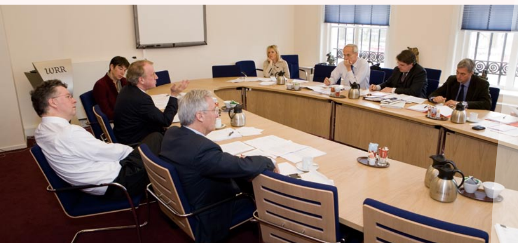
De raad in vergadering

Deze ontwikkelingen beïnvloeden ook rechtstreeks de positie, taak en rolopvatting van de WRR zelf. Dit overigens zonder wijziging van zijn kernfunctie: de regering te voorzien van op basis van wetenschappelijke inzichten geformuleerde nieuwe beleidsrichtingen. De mondialisering die ook het wetenschappelijke bedrijf steeds meer tekent, veronderstelt een WRR die goed is ingebed in een internationaal