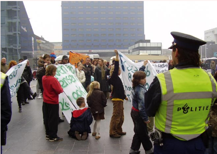
De burgers zijn mondiger en veeleisender geworden

De tijd lijkt ook voorbij dat burgers veranderingen, en zeker de ingrijpende, gelaten accepteren. Zij zijn mondiger en veeleisender geworden, maar tegelijkertijd maakt mondialisering hen onzeker, omdat de vertrouwde politieke beïnvloedingskaders minder vanzelfsprekend lijken te worden. Daardoor bezien zij de grote veranderingen wellicht met argwaan. Waar een beleidsagenda gericht op internationale openheid en culturele tolerantie in de jaren negentig nog op veel draagvlak kon rekenen, lijkt het tij inmiddels gekeerd. De voortgaande mondialisering en de