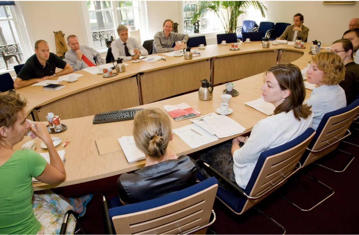
De staf van wetenschappelijke medewerkers in vergadering